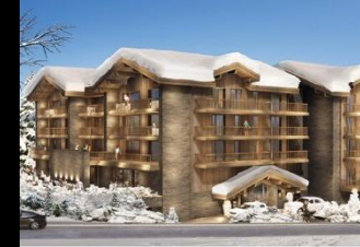
Les Ducs de Savoie Courchevel