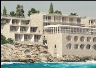
Les Roches Saint Raphaël