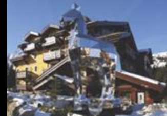
Cheval Blanc Courchevel