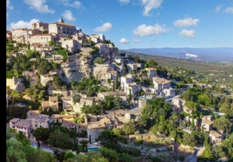
La Bastide De Gordes