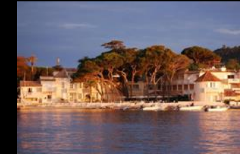
Cheval Blanc Saint Tropez