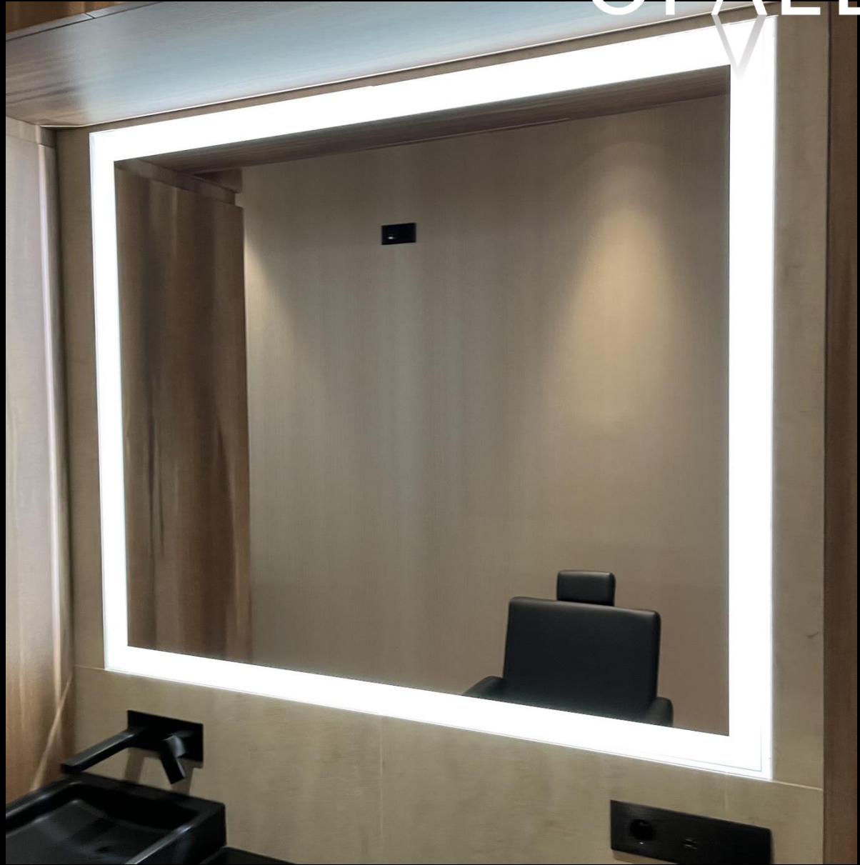
Monaco TV studio lodge