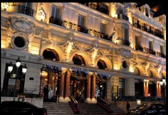
Hôtel de Paris