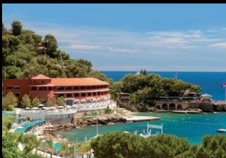
Monte Carlo Beach