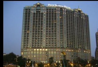
Four Season Nile Plaza - Le Caire