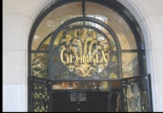
Le Ritz Vendôme Paris