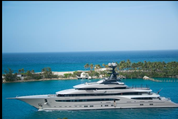
Yacht & Mega Yacht