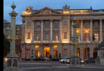
Le Crillon Paris