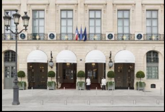
George V Paris