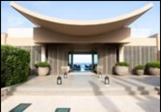
La Reserve Ramatuelle